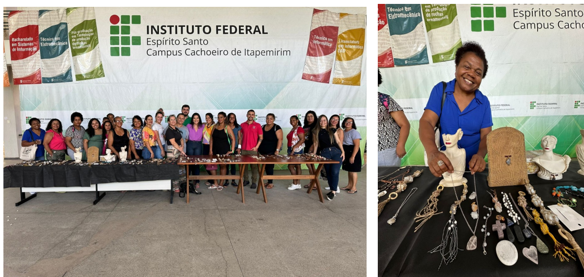
Fotos 11 e 12 - Workshop de Exposição de Produtos – Cachoeiro de Itapemirim