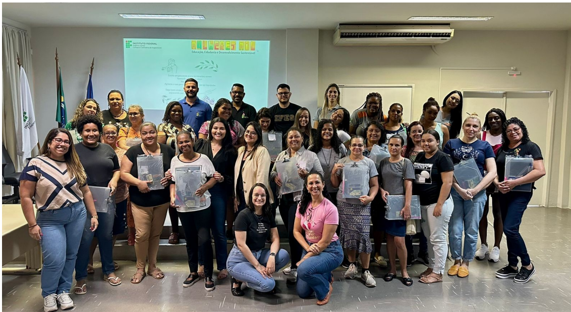
Figura 3 - Aula Inaugural do curso de Artesã de Biojoias - Cachoeiro

A aplicação do Mapa da vida, também se destaca, enquanto método-ferramenta educacional, no itinerário formativo, busca compreender as trajetórias coletivas e individuais das mulheres e realizar o mapeamento dos saberes laborais e tem o objetivo de potencializar o sujeito como autor e protagonista da história da sua vida e de seu grupo, visando criar oportunidade e ambiente para a troca de experiências de vida, para que elas possam ser compartilhadas e então devidamente registradas, validadas e valorizadas.