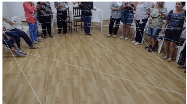
Figura 7 e 8 - Mapa da vida do curso artesã em bordado à mão - Vitória

Os cursos não se limitaram a construir o conhecimento técnico específica em cada oferta dos campi, mas buscaram promover habilidade interpessoais, auto estima, a confiança, o trabalho em equipe. Capacitando-as para vida e empoderando as alunas através dos estudos de temáticas como: saúde; noções de meio ambiente, cidadania, leitura e produção de texto, matemática, noções de empreendedorismo e inclusão digital.