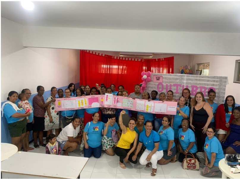
Figura 4 - Mapa da vida do curso Artesã em bordado a mão - Nova Venécia