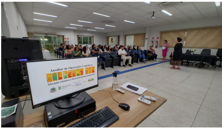
Figura 2 - Aula inaugural de Auxiliar de Logística - Viana