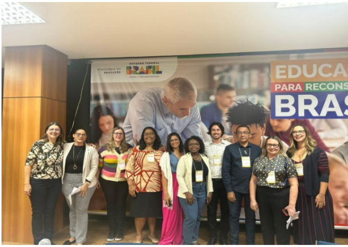
Figura 1 - Grupo de Trabalho e Coordenadora Geral SETEC

O Ministério da Educação (MEC), por meio da Secretaria de Educação Profissional e Tecnológica (Setec), realizou, no período de 24 a 28 de julho de 2023, as Oficinas de Formação na Metodologia de Acesso, Permanência e Êxito do Programa Mulheres Mil.