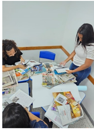
Figura 5 e 6 - Mapa da Vida do curso de Auxiliar em Administração – Aracruz