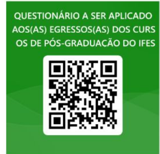
Questionário Egressos Cursos Pós-Graduação