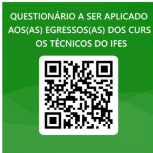
Questionário Egressos Cursos Técnicos

https://proex.ifes.edu.br/relacoes-empresariais-e-extensao-comunitaria/assessoria-de-acompanhamento-dos-egressos