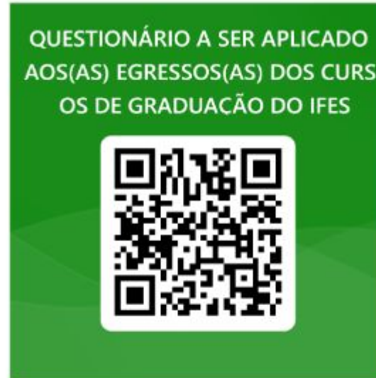
Questionário Egressos Cursos Graduação